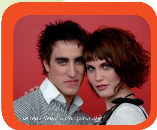
La Saint Valentin, c'est quand déjà?

Les coiffeurs-stylistes du Groupe Martinet Coiffure ont imaginé une collection au naturel glamour, aux boucles aériennes, fluides et enfantines, aux courts angéliques. Nos créateurs ont décidé de jouer