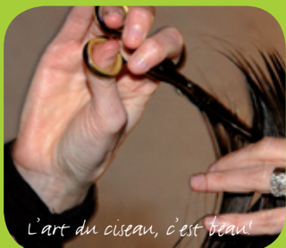
L'art du ciseau, c'est beau!