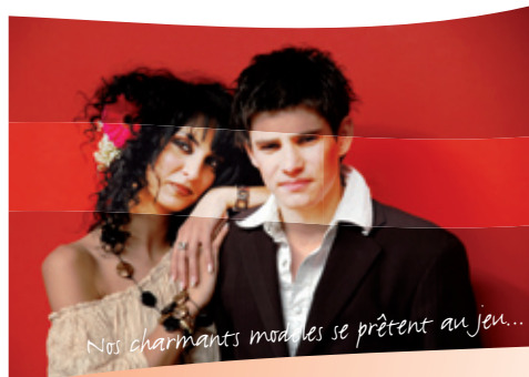
Nos charmants modèles se prêtent au jeu...