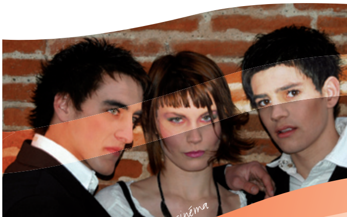
Quand l'inspiration fait son cinéma

femmes et techno hit pour la jeunesse masculine, avec des coupes déstructurées , crêtes et longueurs lisses très « hypes ».